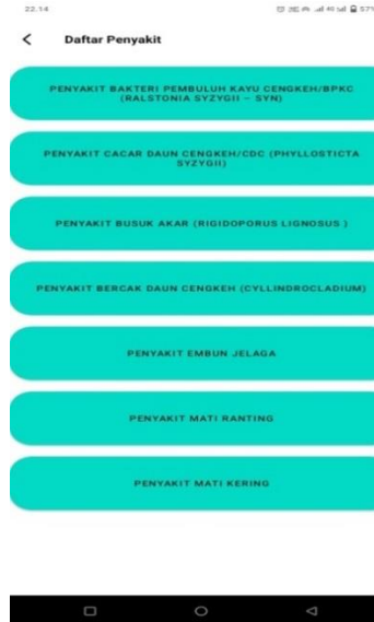
Gambar 3. Tampilan Menu Halaman Daftar Penyakit