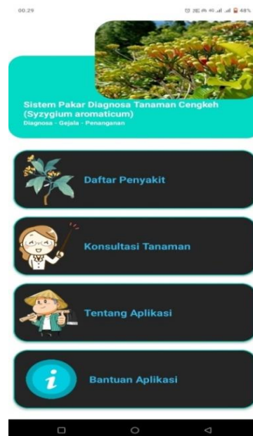
Gambar 2. Tampilan Menu Halaman Beranda

Semua menu halaman beranda dalam aplikasi sistem pakar diagnosa penyakit tanaman cengkeh akan ditampilkan pada halaman beranda. Menu ini termasuk menu daftar penyakit, menu konsultasi tanaman, menu tentang aplikasi, dan menu bantuan (cara menggunakan aplikasi).